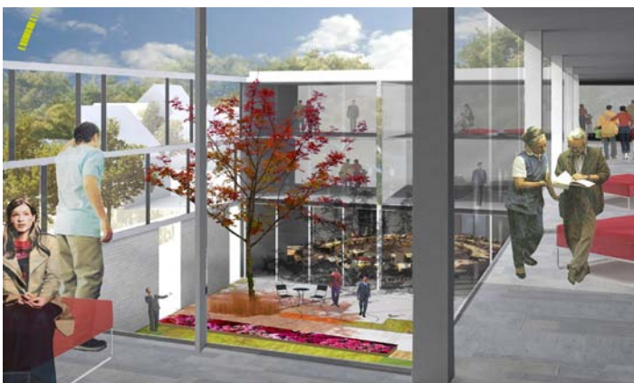
Blick in den Amtsgarten