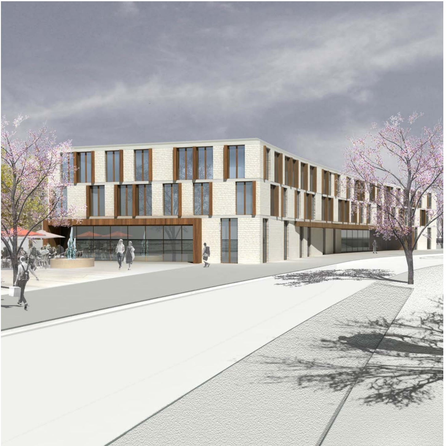
Blick entlang der Karl-Marx Straße auf den Rathausneubau

Planungs- und Bauzeit: WB 2. Preis, Zuschlag im VOF, Sommer 2010 - 2013 Auftraggeber: Gemeinde Blankenfelde-Mahlow Nutzung: Rathaus Auftrag: LPh 1-5; §33 HOAI (2009) BGF: 4.550 m 2 Baukosten (KG 300 + 400): ca. 8,21 Mio. EUR